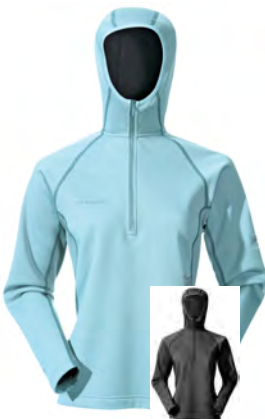
glacier 928 black 001