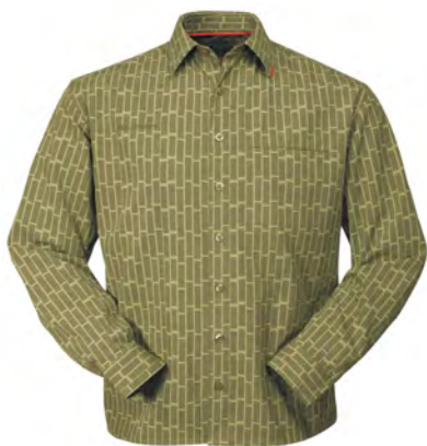
lizarddark olivelemongrass 445