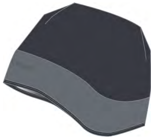
carbon smoke 913

Material / Fabric: Outershell: VENTech[TM] 150 Fleece; Palm: VENTech[TM] 200 Fleece Grösse / Size: S-L