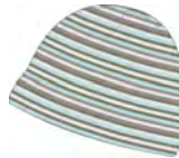
glacier-taupe-silver- dark olive 923