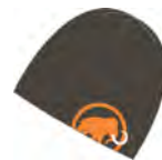
dark olive-pumpkin 922