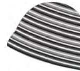
silver-carbon-taupe- black 911