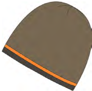
lizardpumpkindark olive 766

Material / Fabric: Grösse / Size: one size