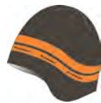
dark olive-pumpkin 922