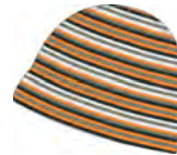
pumpkin-dark olive- liver-lizard 221