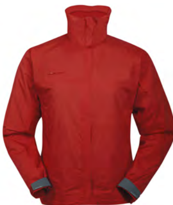
brick 313 bark 751