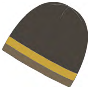
dark olivelemongrasslizard 475

Material / Fabric: Grösse / Size: one size